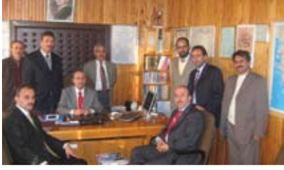
Ardahan İl Müftülüğü ziyaret edildi

Erzurum Bölge Toplantısı sonrası Ardahan, Ağrı İl Müftülükleri ile Oltu İlçesi Müftülükleri ziyaret edildi.