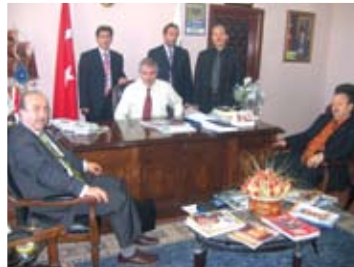
Dadaşkent Belediyesi ziyaret edildi