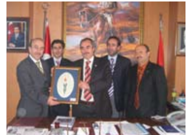
Kazımkarabekir Belediyesi ziyaret edildi