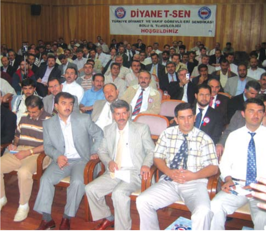
Seminere yoğun katılım oldu