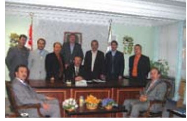
Ağrı İl Müftülüğü ziyaret edildi