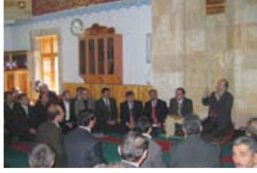
Oltu İlçe Müftülüğü Toplantısına İşdirak edildi